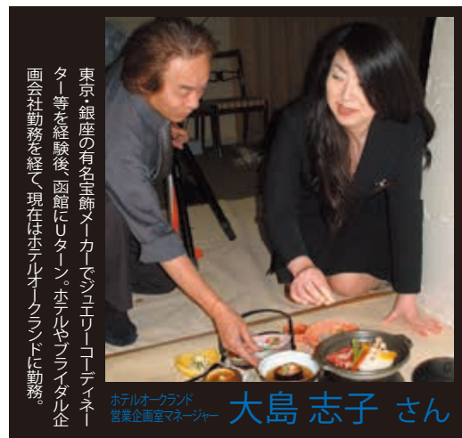
東京銀座の有名宝飾メーカーでジュエリーコーディネーター等を経験後、函館にUターン。ホテルやブライダル企画会社勤務を経て現在はホテルオークランドに勤務。