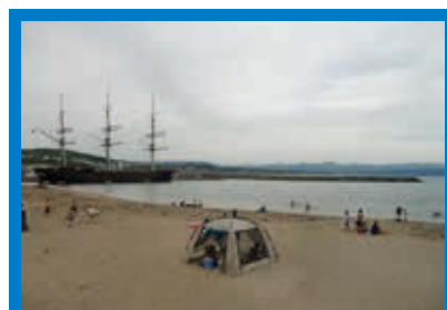
■開設期間/平成24年7月21日～8月14日 ■駐車場/有 ■トイレ/有

月21日午前10時の海開きの前(午前9時半頃)には、救助訓練が行われる予定です。昨年は、消防本部や日赤水上安全法奉仕団さらには海上保安本部函館航空基地のヘリコプターも出動し行われました。今年の夏も湯川海水浴場で楽しみましょう。開設時間は午前10時～午後4時30分。近隣には温泉施設が充実しているので、泳いだ後には温泉で温まるのもいいですね。