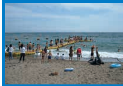
■開設期間/平成24年7月21日～8月19日 ■駐車場/有 ■トイレ/有

湯川海水浴場 函館市熱帯植物園裏にある『湯川海水浴場』は、ネット式海水浴場と呼ばれ市民に親しまれています。