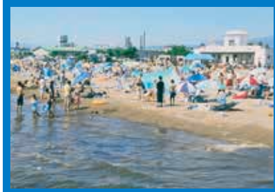
■開設期間/平成24年7月21日～8月19日 ■駐車場/有 ■トイレ/有

函館市内からも近く、駐車場も完備されているので、とても身近な海水浴場として親しまれています。函館湾に面した砂浜の海水浴場で、温水やシャワーや更衣室も完備しているのを利用して、家族連れやカップルなど、さまざまな人達が