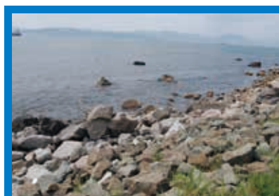
■開設期間/平成24年7月26日～8月19日 ■駐車場/有 ■トイレ/有

岩浜で磯遊びが楽しめる 函館山の麓にある『入舟町前浜海水浴場』は、海水浴だけでなく、岩浜の自然海岸の海域にブイを設置して遊泳することができます。また、目の前に広がる海や背景に広がるダイナミックな函館山の山肌など、自然の眺望は秀逸。付近には、絶景の夕陽を眺めながら飲み物を味わうことができます。