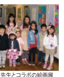
ガルシア先生とコラボの絵画展

「英語 de アート」サマークラスは、大学で造形美術を学び、ニューヨークでアートデザインナーとして活躍していた外国人講師が、英会話レッスンに加えて工作や絵画などを英語で教える人気のクラスです。子供の創造力、表現力というアートの感性を伸ばしながら、同時に英語の環境にいることで英会話の能力も自然に伸ばすことができます。