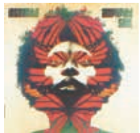
インコグニート 「アンプリファイド・ソウル」 (2592円)

もう一枚のオススメは、インコグニート「アンプリファイド・ソウル」。今年で35周年を迎えたブルーイ率いる元祖アシッド・ジャズ・バンドの通算16作目の最新作。80年代の頃といい意味で何も変わっていないそのサウンドは、40代以上にはかなり効き目あり。ジャジーでお洒落でグルービーでヘビーローテーション的なカットコ良さです。カーリン・アンダーソンやニック・ヴァンゲルダール(ジャミロクワイ)らをゲストに迎えつつ、トニー・モムレル、ケイティ・レオネ、そして新加入のキアラ・ハンターの3人のヴォーカルが熱い! 全17曲。2枚とも、〇〇すぎずにちょうどいいです。