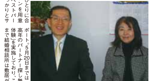
50~60代のシニア世代の男性も大歓迎です!

結婚願望はあるものの理想の出会いに恵まれない...というあなた! 全国各地の人の巡り合いをサポートしている「らぼーとブライダル」に相談してみればいかがですか。