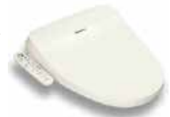
パナソニック「ビューティー・トワレ」