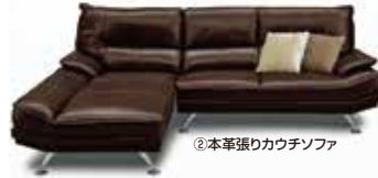
②本革張りカウチソファ

ソファのほかにもオリジナル家具を豊富に用意しているので、リビングを自分好みのテイストでそろえたい人や、昨今の値上げの影響で家具買い替えを悩んでいる人は、この