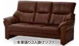
①本革張り3人掛けソファ

ソファをお得に購入できるアウトレット大特価セールを開催中! 各メーカーから驚きプライスの商品が大量入荷しているほか、同店オリジナルソファも数多くそろい、写真の①本革張り3人掛けソファ(税込55,000円)や、②本革張りカウチソファ(税込110,000円)など、目玉商品も多数! さらに、4月27日(土)～5月6日(月・振休)の期間限定で、この記事を持参した人に税込55,000円以上の購入で配送料と設置料が無料、税込110,000円以上の購入で配送料、設置料、処分料無料のサービスも実施。フェア開催中は商品の入れ替わりが早くなることが予想されるため、一期一会の出会いを求めるならこまめに足を運んでみるのがオススメです。