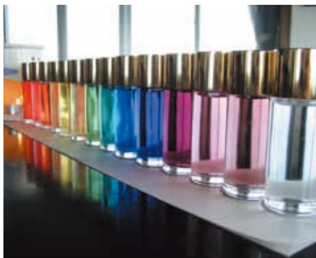
ハッピーカラー ☎090-2816-7422 (予約制) http://www6.plala.or.jp/izuminomori/happy.html

カラーセラピーは直訳すると「色彩療法」。14本のカラーボトルから気になる色のボトルを選び、その色を通して心の状態を知るといふもの。自分のヒーリングカラーを覚えてもつるよ。ちなみに、取材時の私のヒーリングカラーは「緑」。緑色の小物を持つとか、自然の中へ出かける、緑黄色野菜を多くとるなど日常生活で緑を取り入れると、さらに人生が豊かになり、道が開けてゆくのかも…とつれいじい言いに大満足！ カラーセラピーは一回3500円。