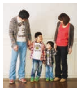
1〜2ページの特集企画の掲載写真は 全てイメージです。本文の内容とは関係 ありません。

今回の特集で紹介したエピソード は、昨年12月17日号の『クリスマス プレゼント特集』で、プレゼントハ ガキに添えていただいた読者の皆様 からのメッセージです。文章は、より 読みやすいよう、若干手を加えて いるものも一部あります。