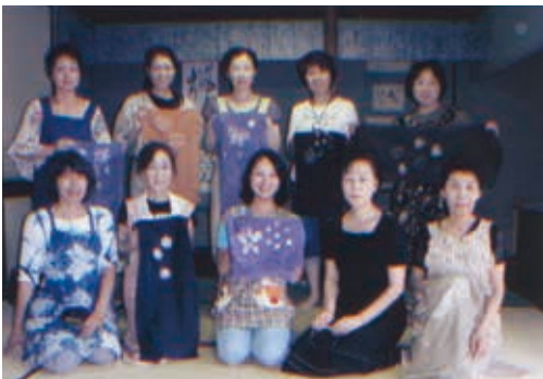
毎年新しいことにチャレンジしているこの教室では、昨年草木染め教室を開催、絞りの技法でオリジナルの帯揚げを作りました（写真）。今年も、日本刺繍で個性的な襟元を演出する半襟を作る教室を予定しています。