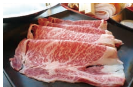
白老和牛リブローズしゃぶしゃぶランチ

この11月より『ホテルリソル函館』10階レストラン「いちばん」のランチメニューがリニューアルしました。リニューアル後は、ホテルの味を気軽に味わえるランチに加え、厳選食材を贅沢に味わえるメニューが登場。中でも、人気を集めているのが「白老和牛」を使ったメニュー。「白老和牛リブローズ」(3800円、赤身は2300円)や「白老和牛ローストビーフ丼」(3000円)は、ランチタイムを豪華に演出。森ひこま豚