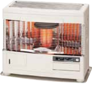
サンポットFF式床暖ストーブ

石油ストーブやボイラーなどの分解整備をはじめ、エアコンの掃除にも定評の「有限会社富士サービス」では、10月26日より「サンポット薄型タイプストーブ」を3320円のところを、2台限定11万7720円、「FF式床暖ストーブ」を46000円のところを、1台限定15万4400円に購入できる。断然お得と、断然お得に購入できる。設置と古いストーブの廃棄も無料。設置条件により部材のみ別途必要な場合があります。☎47-6305