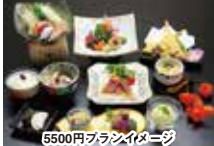
5500円プランのイメージ