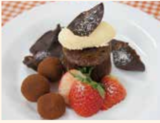
フォンダンショコラ