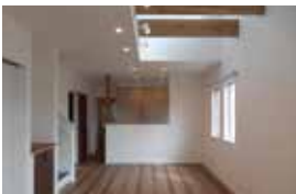
オープンハウス室内

七重浜新築住宅オープンハウス 函館駅前にある1975年創業の「株式会社秋山不動産」は、新築住宅・中古住宅・賃貸から、貸事務所など専門的に取り扱っている不動産屋さん。店舗も清潔で、スタッフも親切丁寧・親身に対応してくれるので、小さな悩み事でも気軽に相談できます。そんな街に不動産さんでは、七重浜新築住宅にてオープンハウスを開催します。開催日は、8月25日(日)午前11時～午後4時。会場は七重浜3丁目8番。七重浜駅から徒歩で、家族が