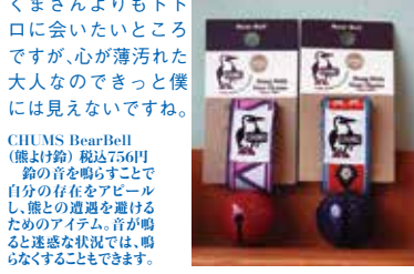
CHUMS BearBell (熊よけ鈴) 税込756円 鈴の音を鳴らすことで自分の存在をアピールし、熊との遭遇を避けるためのアイテム。音が鳴ると迷惑な状況では、鳴らなくすることもできます。

先日、北斗市の無料キャンプ場へ行ったら、パトカーが赤色灯を回して近づいてきました。「2時間前にすぐそこで熊が出たので気をつけてください」と警告され、大阪から移住して来た私はビックリしました。ネットで調べると近隣のあちこちで出てくる出てくる熊出没情報。熊ってこんなに身近でしかも頻繁に出没するんですね。リアル「森の中くまさん」ですね。当店の商品で「ベアベル」という熊よけの鈴があるのですが、アクセサリなんかではなく本当に必要だということがわかりました。できれば森の中くまさんよりもトト口に会いたところですが、心が薄汚れた大人なので僕には見えないですね。