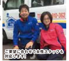
ご要望に合わせて女性スタッフも対応します!