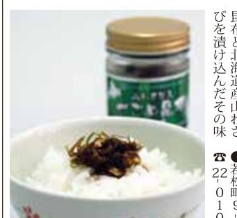
今月の逸品 有限会社函館カネニ 山わさび入 がごめ昆布しょうゆ味

を続けている。「函館市で取り組まれている文化芸術アウトリーチ事業で書道講師としていくつかの小学校で声をかけていたかまじい。書道は「伊妹」になりがちかもしれないが、生から書道の授業があり、天満谷さんも幼稚園から高等学校までの子供達や町内の人達に書道を教えるようになった。昨年からは函館市内に住居を移し、自宅で「書の教室 優玄」を開校。さらに松前町と函館市のことも園で書道の講師