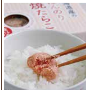
株式会社丸鮮道場水産 北海道産のほんのり焼きたらこ

原原本来の味わいを大切にしたらたらこや、明太子、いくらなどが評判の鹿部町にある『丸鮮道場水産』。新商品の北海道産のほんのり焼きたらこ(120g)を648円は、噴火湾産のたらこの表面だけをさっと焼いた外はつぶつぶ、中はしっとり半生タイプの焼きたらこ。素材本来の美味 ●鹿部町字字浜194-2 ☎0120・472523