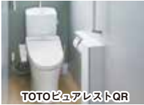
TOTO BioArest QR

水まわりの緊急メンテナンスで好評の「第一住宅設備」では、節水トイレへの取り替えキャンペーンを行うと、いつも大好評です。すぐに販売限定数に達するので、そう。要望にお応えして今回も価格据え置きで提供します！ 前回のキャンペーンを見逃してしまった人もこの機会に取り替えませんか？