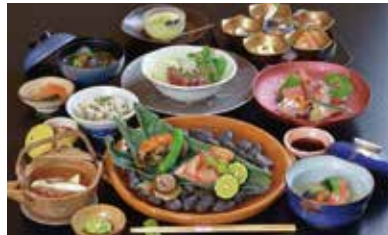
料理内容は写真と異なる場合があります

1949年創業の老舗として親しまれている『竹葉新葉亭』では8月27日~9月30日の期間中、敬老の日の特別企画として、「日帰り会食プラン」を実施します。 料金は1人8800円(税込)。特典は、食事の際に1人につきワンドリンクサービス(生ビールまたはソフトドリンク)と温泉入浴付き(食事の前後)。要事前予約。予約時に「青ぼ見た」でお伝えください。満室の場合など希望日に予約できない場合もありますので、詳しくはご利用希望日の前に電話でお問い合わせください。 美しい竹林と趣ある枯山水を配した庭園。この機会に全国的に有名な老舗で、函館の奥座敷・湯の川温泉の魅力をつぶりと満喫してみませんか？ ●函館市湯川町2・6・22 ☎0138・57・5171