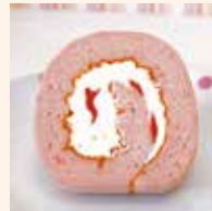
モンブランルーレ いちご