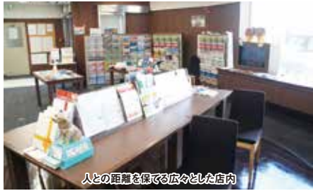
人との距離を保てる広々とした店内

旅行に関する、確かなオススメ情報を把握している『JTB函館五稜郭店』に、旅の相談をしてみませんか。数あるプランのなかでも特にオススメの「行くべ! 函館湯の川温泉!」は、はこだて割を利用して