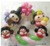
▲催祭り用のバルーンギフト

細長いゴム風船「ペンシルバルーン」を使って即興芸を行う「バルーンパフォーマー」。イベントなどで動物などの形を作る「ツイストバルーン」の技を、間近で見たことがある人も多いのでは。