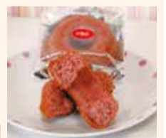
函館窯出しドーナツ いちご 259円

人気のフリーズルーレの上に、紅ほっぺいちごのクリームをたっぷりのせた同店ならではのモンブランケーキ。新商品につき現在、特別価格で販売中です。