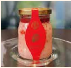
贅沢いちごぶりん