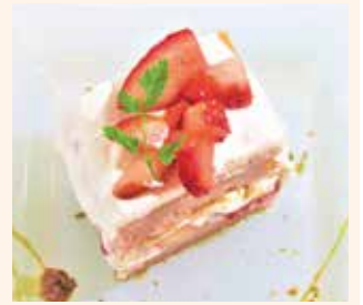
いちごのケーキ ドリンクセット1200円

生地にいちごのピューレを混ぜ込んだ、いちご好きにはたまらない一品。自家焙煎コーヒーか紅茶を選んでティータイムを楽しんで。