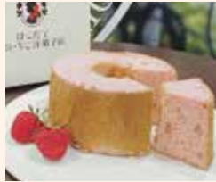
いちごのシフォンケーキ カット500円 ホール2200円

「はこだて恋いちごを使った焼き菓子が食べたい」という要望に応え登場。サクとした食感の後、口の中でとろけます。