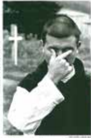
奈良原一高 王国 Domains

戦後を代表する写真家の1人・奈良原一高。長らく絶版が続いた後、未発表作を加えた作品集『王国-Domains』が新装刊行されたのが2019年。本作品展では、遺族から一昨年度末、北海道立函館美術館に寄贈された、前述の作品集収録作品に未掲載作品を加えた約170点を展示。静謐さの中に孤独感や悲しみなどをにじませた『王国』の世界観を紹介する。日本の写真史に残る名作群。