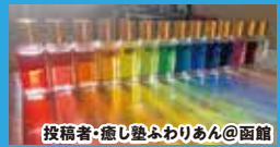
投稿者・癒し塾ふわりあん@函館

地元で活躍中のパフォーマーさんたちからも多数の投稿が! 専業主婦みなさん虹も出せるなんてすごい!!