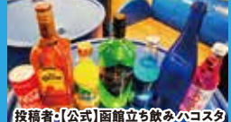
投稿者・[公式]函館立ち飲みハコスタ