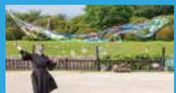
投稿者・魔女Meque@絵とシャボン玉