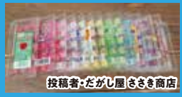
投稿者・だがり屋さきき商店

「さっぽろレインボープライド2023」の開催に合わせて虹色がテーマの写真を集めました。まずは、「会いに行ける虹」をピックアップ!