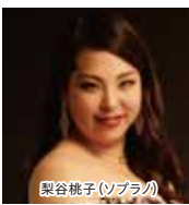
梨谷桃子(ソプラノ)

開場13時15分、開演14時。全席指定前売一般3,000円、学生(高校生以下)1,000円、当日券は各500円増し。チケットは会場となる函館市芸術ホールで販売、または下記までお問い合わせを。未就学児入場不可。公益財団法人さわかみオペラ芸術振興財団