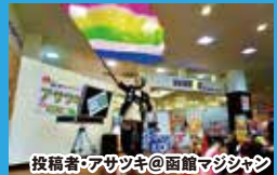
投稿者・アサツキ@函館マジシャン

地元で活躍中のパフォーマーさんたちからも多数の投稿が! 専業主婦みなさん虹も出せるなんてすごい!!