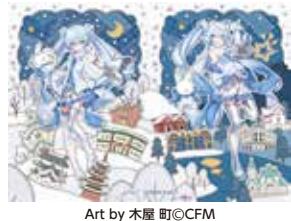
Art by 木屋 町©CFM

北海道応援キャラクター「雪ミク」連携による青森県弘前市と函館市合同の冬の観光キャンペーンが12月1日からスタート。周遊企画「雪ミクパズルコレクション」をはじめ、フォトスポットパネル設置、ウェブARを利用した「雪ミク」と写真撮影・SNSキャンペーンなどが両市各スポットで展開される。2024年2月29日(木)まで。詳細は下記2次元コードの「ひろはこ特設ページ」で確認を。