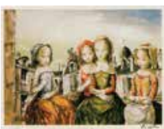
藤田嗣治「パリの少女達」(リトグラフ)

「はこだてギャラリー」が開業50周年を記念し企画展を開催。店内に展示している絵画・工芸品を全品半額で提供する。観覧のみも歓迎。美術品好きは必見!